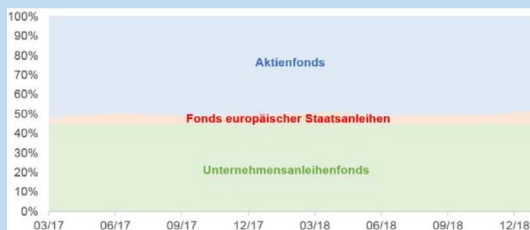
Durchschnittlicher Aktienanteil von Zurich Verträgen im Bestand mit einer Garantie von 80 % nach Vertragslaufzeit**